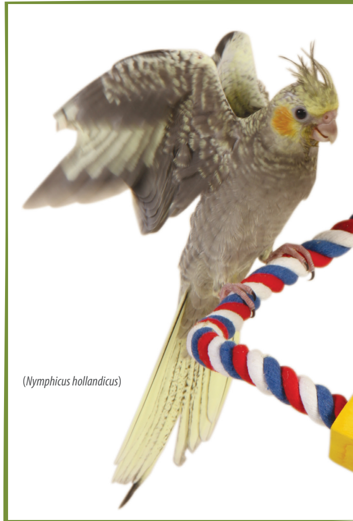
( Nymphicus hollandicus )