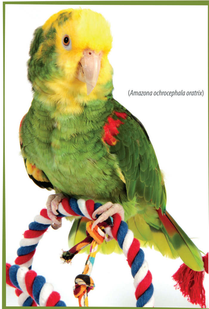
(Amazona ochrocephala oratrix)